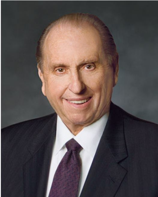
Thomas S. Monson, „Seien Sie ein Vorbild und ein Licht“, Liahona, November 2015