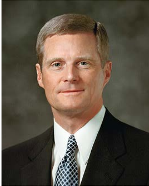
David A. Bednar, „Light the World“, Ensign, Dezember 2016